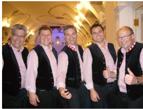
Krainerkameraden in Action und erfreut über den guten sechsten Rang!