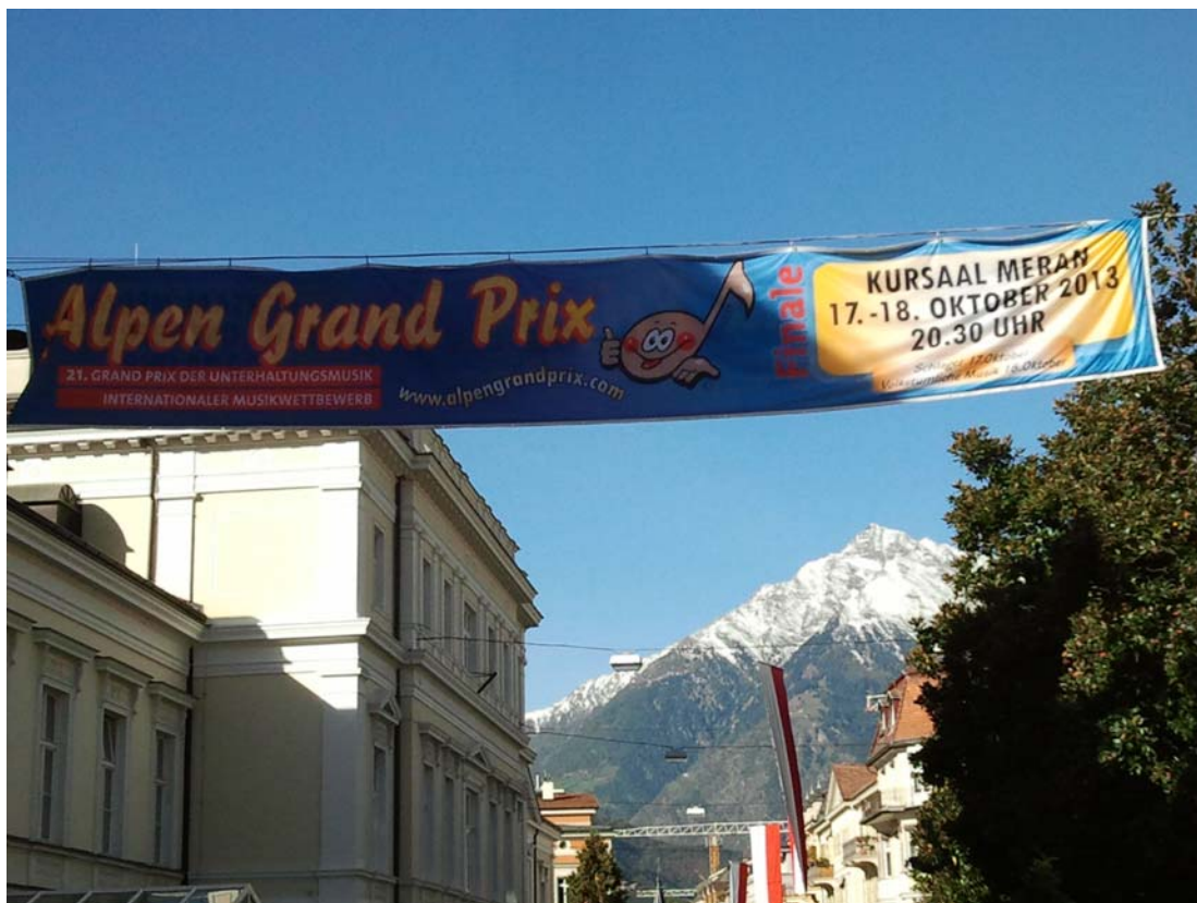
„Schulreisli“ bei schönstem Herbstwetter nach Meran