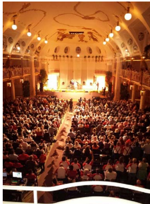
Der schöne Saal im Kurhaus Meran vor und während der Veranstaltung