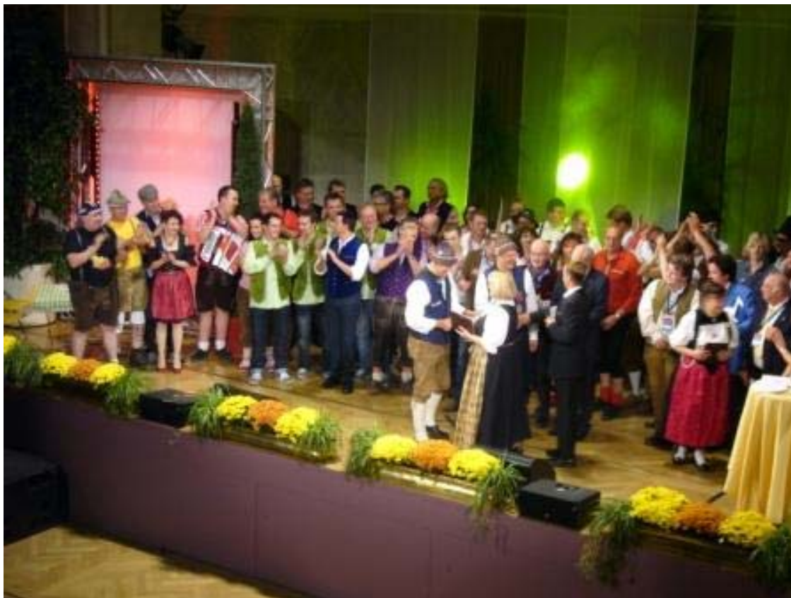
Schlussbild mit allen Teilnehmern